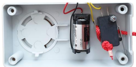
Figure 3: Emplacement de la batterie

Abilanx Park Avenue Rue Léon Griffon 56890 Saint Avé Tél : 02 97 63 70 46 Fax : 02 97 63 74 90 Courriel : contact@abilanx.com Web : www.abilanx.com