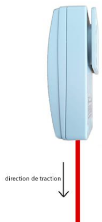
Figure 1: alerte