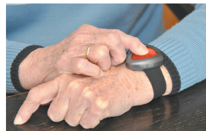
● Emetteur bracelet