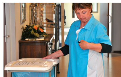
● Personnel de soin reçoit l'alarme