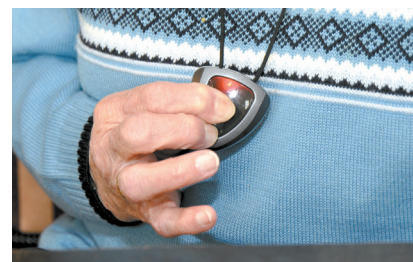
● Emetteur de cou Médaille

Pour trouver la meilleure solution pour votre situation, veuillez prendre contact avec votre distributeur ou bien auprès de nos équipes Abilanx.